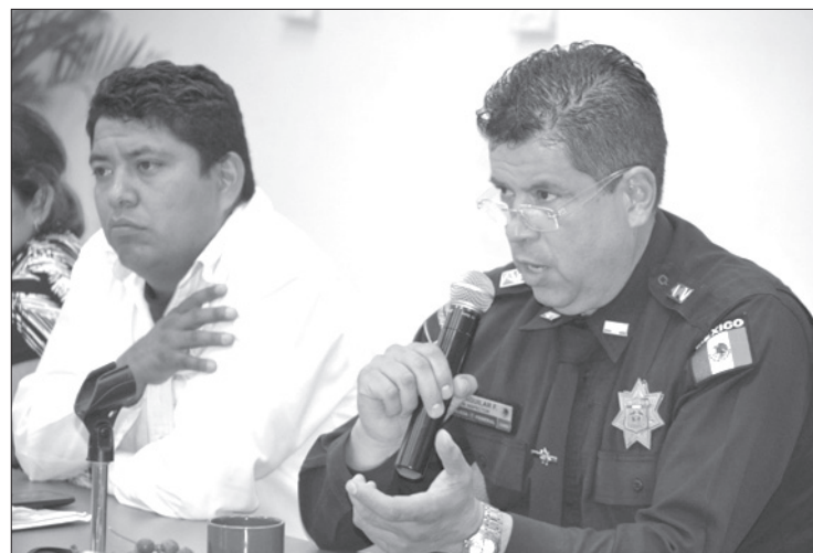
Representantes de la PFP participaron en la reunión

De esta forma, entre los compromisos pactados durante este encuentro destacan la implementación por parte de Capufe de señalética que indique las rutas alternas viables durante el tiempo que duren las reparaciones, así como el envío