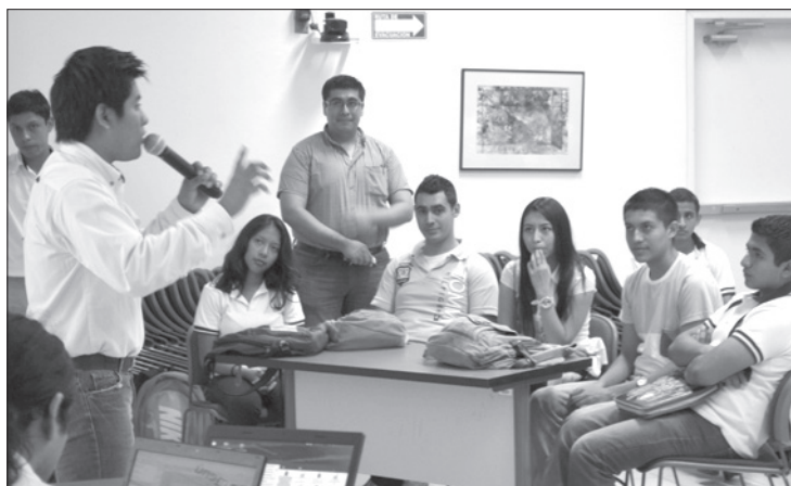
Estudiantes de Sistemas Computacionales impartieron los talleres

"Con tecnología propia, la Universidad está haciendo tres de ellas como muestra; primero