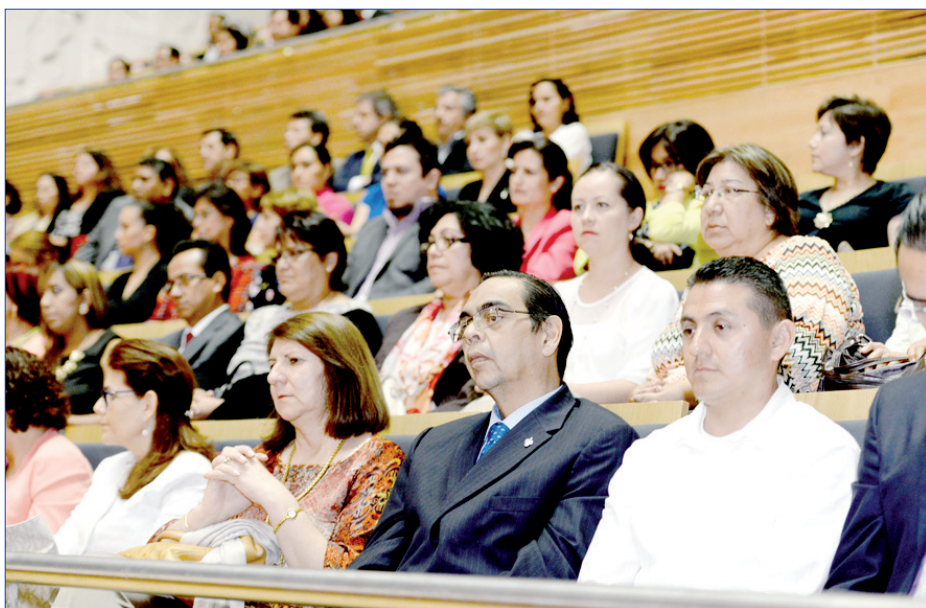
Académicos, decanos y estudiantes de todas las regiones atendieron el informe