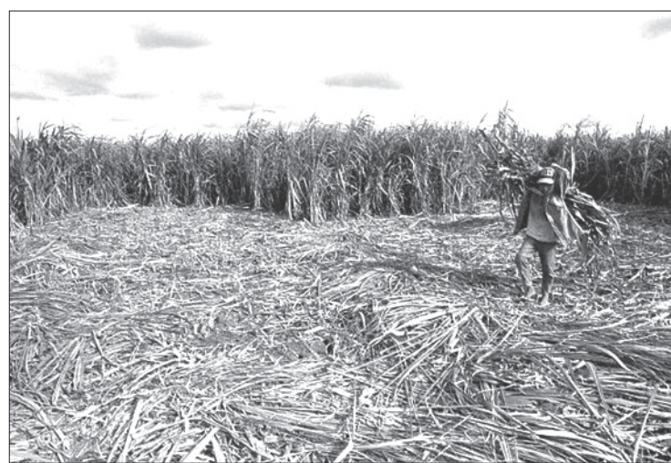
Es un cultivo importante en varias partes de América Latina

“Lo que queremos es proporcionar este conocimiento de la caña de azúcar, por ejemplo, tenemos (en Veracruz) cuatro ingenios cerrados totalmente y nosotros hicimos un estudio con los productores y obreros de éstos. Ellos nos decían la difícil situación que atraviesan, porque