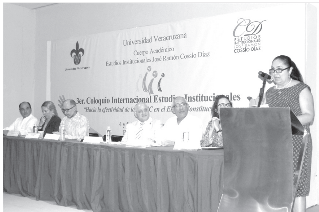
La Rectora inauguró el 3er Coloquio Internacional Estudios Institucionales