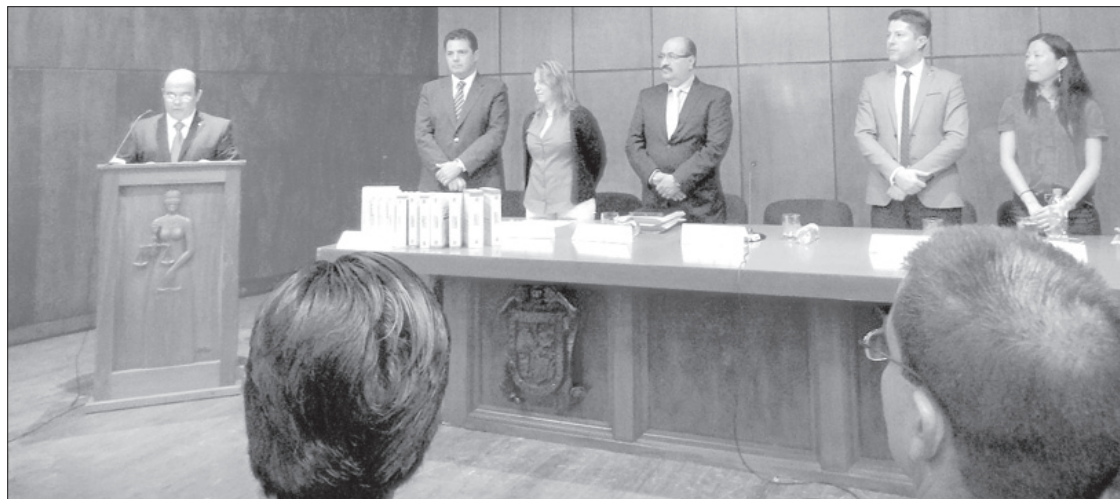
El ejercicio académico reunió a especialistas de América y Europa