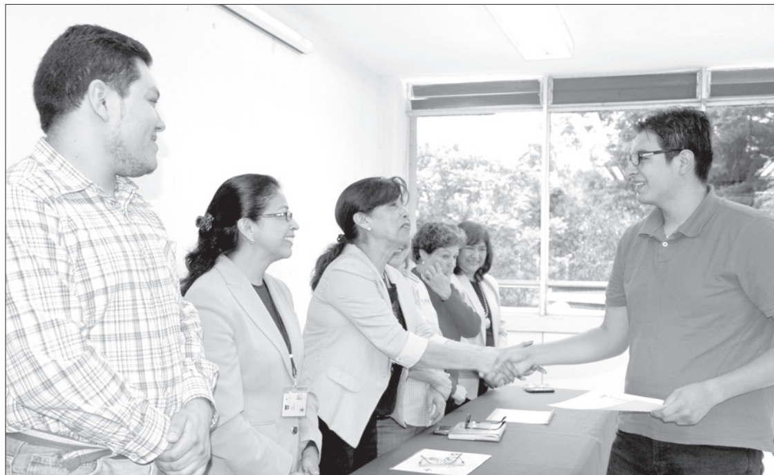
Autoridades reconocieron el esfuerzo de los alumnos