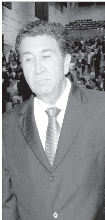
Héctor Yunes Landa