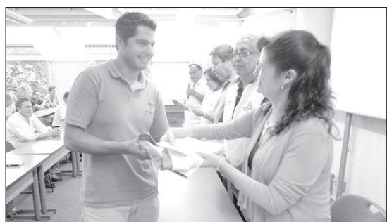
Se entregaron constancias y chalecos distintivos