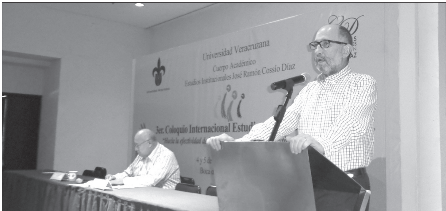
José Ramón Cossío Díaz

Afirmó que las mejoras al marco jurídico se resolvieron el 10 de junio de