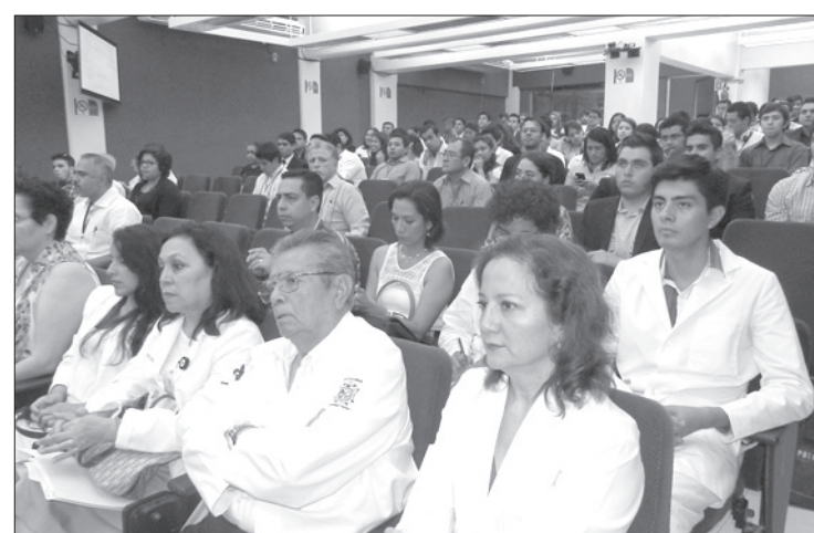
Especialistas y estudiantes asistieron al congreso