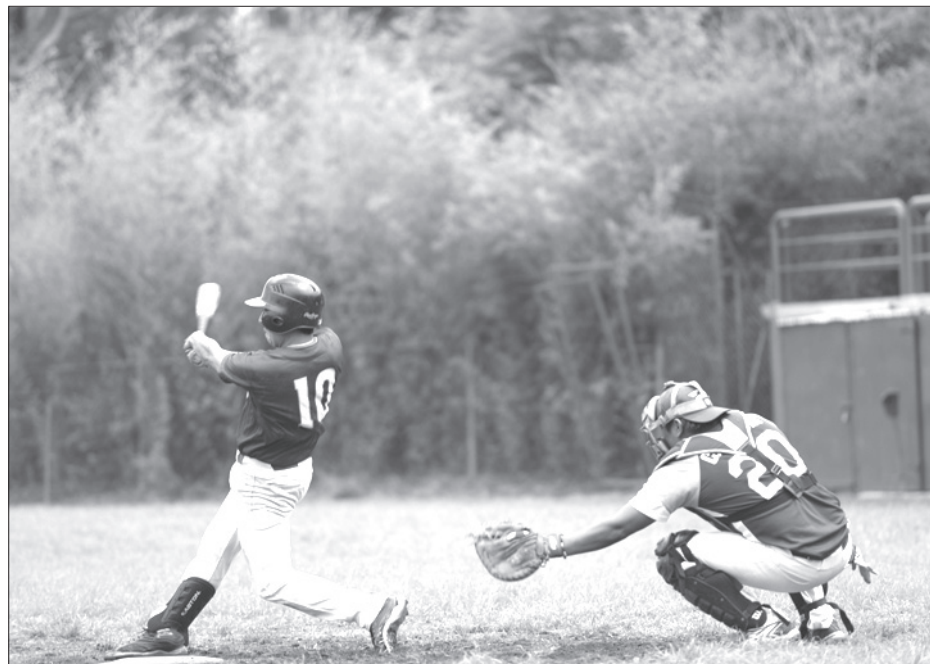
Los jóvenes asisten con gusto a torneos, entrenamientos y cursos