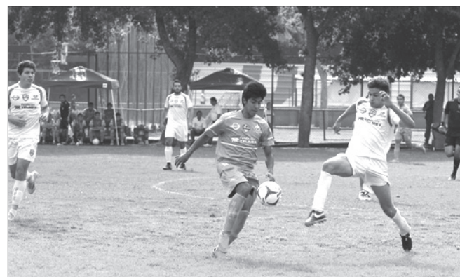
El encuentro fue cerrado de principio a fin

Empataron a un tanto con el Tec de Monterrey