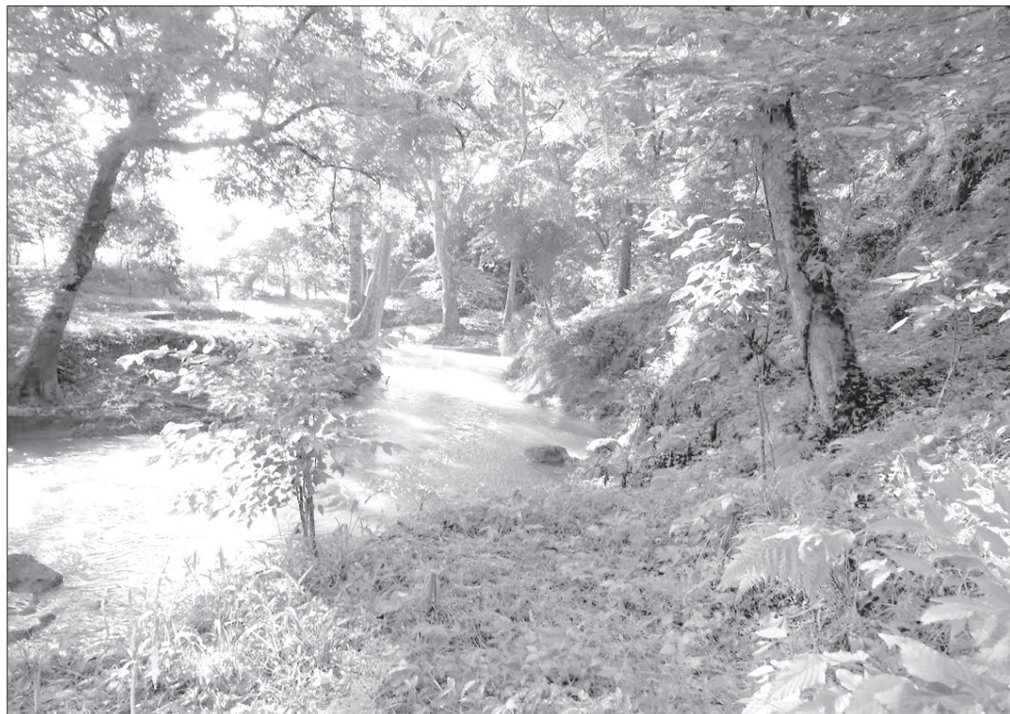
El afluente divide los municipios de Xalapa y Banderilla

A lo largo de casi dos décadas, la sociedad civil organizada, en conjunto con los sectores gubernamental y académico, han logrado diversos avances para la preservación y gestión sustentable de dicha cuenca, como ejemplo, en 2005 se logró suscribir el “Convenio intermunicipal para el rescate y sustentabilidad de la cuenca del río Sedeño”.