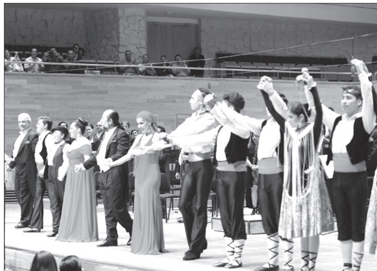
El elenco agradeció la entrega del público

El repertorio fue seleccionado cuidadosamente a modo de equilibrar las intervenciones del Coro, de cada uno de los solistas y del cuerpo de ballet la Compañía de Danza ‘Fernanda Guerra’ que completó el espectáculo.