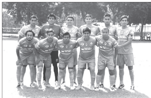
Los veracruzanos consiguieron dos puntos más