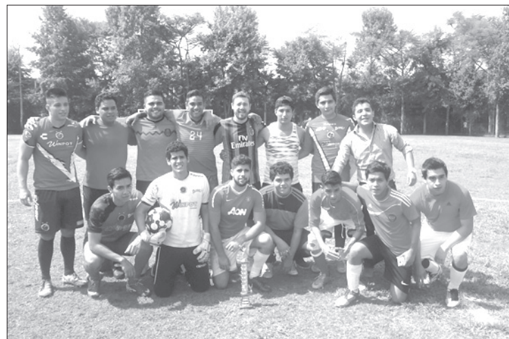
Amigos y Rivaless, monarca del futbol de Derecho

Para llegar a la final, Amigos derrotó al Atlético Maynez,