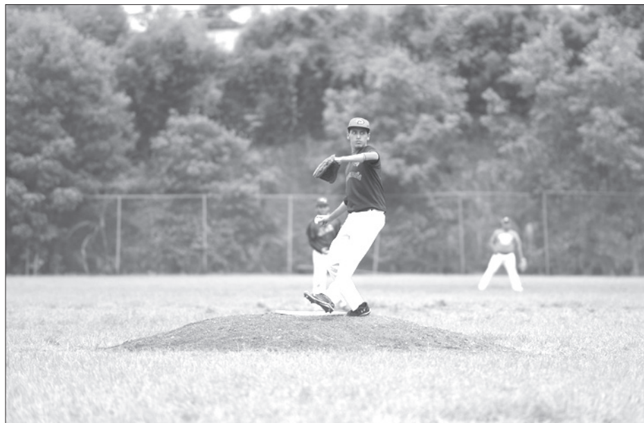
El nivel mostrado en los interfacultades fue alto

Se integrará la Selección Xalapa, rumbo al Festival Estatal Universitario