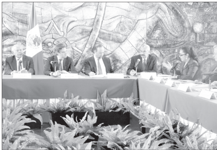
La Rectora expuso la importancia de ampliar la cobertura con equidad