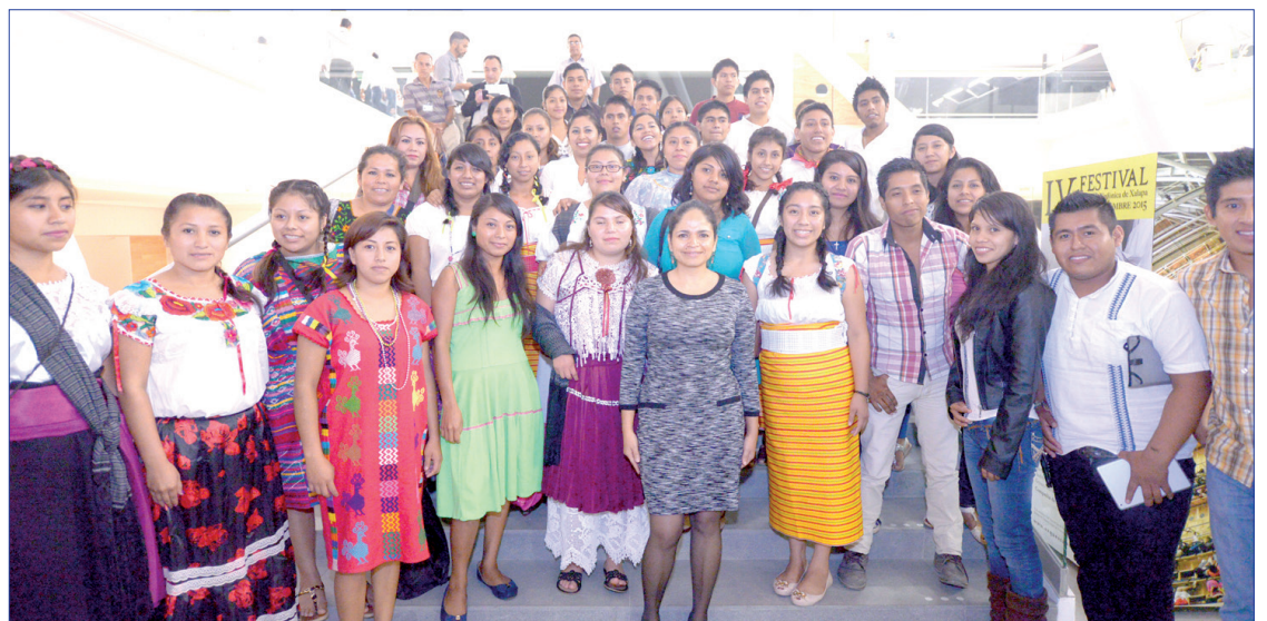
Integrantes de la Universidad Veracruzana Intercultural asistieron al evento

En cuanto a las tradiciones cultural y editorial de esta casa de estudios, informó que se llevaron a efecto 730 eventos a nivel estatal, nacional e internacional, a los cuales asistieron más de 276 mil espectadores, mientras que la Editorial de la UV lanzará en noviembre la página web de venta de libros electrónicos y el catálogo en línea.