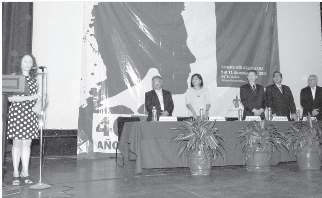
Autoridades y comunidad científica inauguraron el congreso