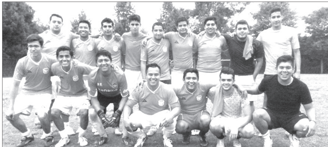
Enfermería se impuso en el Torneo de Ciencias de la Salud