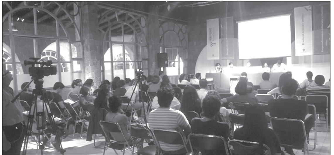
Aspecto de la mesa “Emprendimientos culturales”

Abundó al decir que no es un secreto que el contexto actual obliga a los artistas a trabajar en esquemas que interfieran en la forma de producir sus espectáculos, incluso en las decisiones de su forma de vida, multiplicar sus habilidades, trabajar en subempleos, desarrollar oficios alejados del arte o abandonar la gestión de éste.