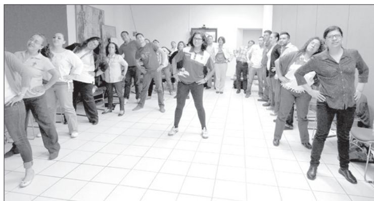
Los primeros 60 voluntarios recibieron capacitación