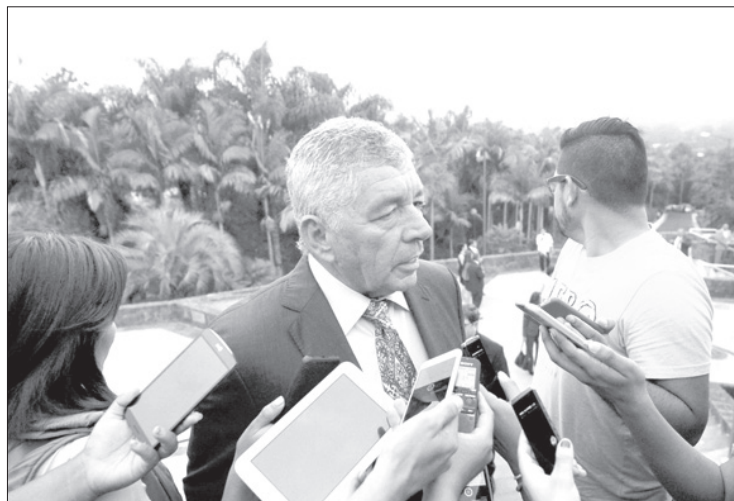
El ex Rector asistió al Informe de Actividades

“Es un tema que a muchos expertos en jurídica educativa