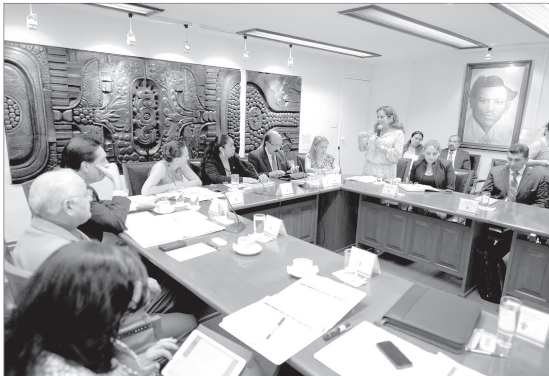
Directivos del centro informaron sobre la aplicación del EXANI II en esta casa de estudios

Rendimiento de sus aspirantes seleccionados, por arriba del promedio