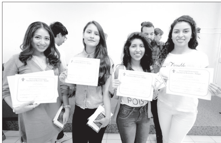
Los jóvenes se distinguieron por su desempeño

Tal problemática es cada vez más frecuente y aguda, y tiene mucho que ver con las